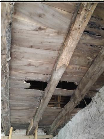
Photo n° PhTer002 Localisation : Dépendance - Grenier Ouvrage : Sol - Plancher bois Plafond - Charpente bois + tuiles Parasite : Présence d'indices d'infestation d'autres agents de dégradation biologique du bois Indices : présence de trous de sortie (dégradation(s) importante(s))