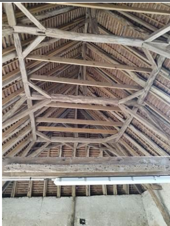
Photo n° PhTer001 Localisation : Dépendance - Grange Ouvrage : Charpente, Panne, Solive Parasite : Présence d'indices d'infestation d'autres agents de dégradation biologique du bois Indices : présence de trous de sortie