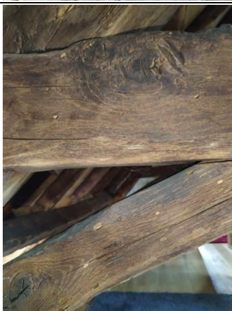
Photo n° PhTer003 Localisation : 1er étage-Maison principale - Palier Ouvrage : Plafond - Element de charpente + Lambris et Vernis Parasite : Présence d'indices d'infestation d'autres agents de dégradation biologique du bois Indices : présence de trous de sortie (dégradation(s) faible(s))