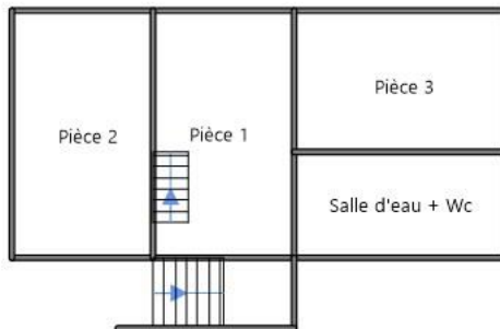
----- 1er étage-Maison annexe -----