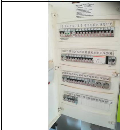
Photo du Tableau électrique