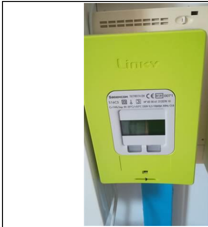
Photo du Compteur électrique