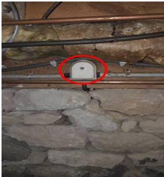
Photo PhEle003 Libellé de l'anomalie : L'installation comporte au moins un matériel électrique vétuste. - Interrupteur + fusible - Boitier porcelaine - Porte douille porcelaine - Gaine métallique - Douille de chantier en métal.