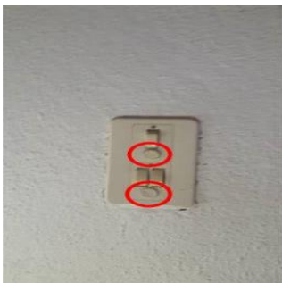
Photo PhEle003 Libellé de l'anomalie : L'installation comporte au moins un matériel électrique vétuste. - Interrupteur + fusible - Boitier porcelaine - Porte douille porcelaine - Gaine métallique - Douille de chantier en métal.