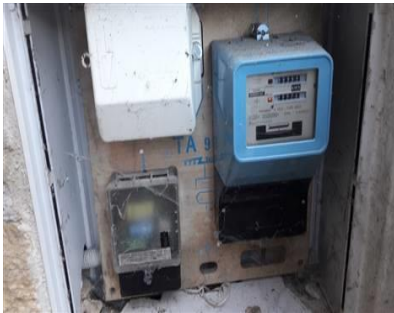
Photo du Compteur électrique