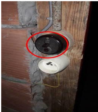
Photo PhEle003 Libellé de l'anomalie : L'installation comporte au moins un matériel électrique vétuste. - Interrupteur + fusible - Boitier porcelaine - Porte douille porcelaine - Gaine métallique - Douille de chantier en métal.