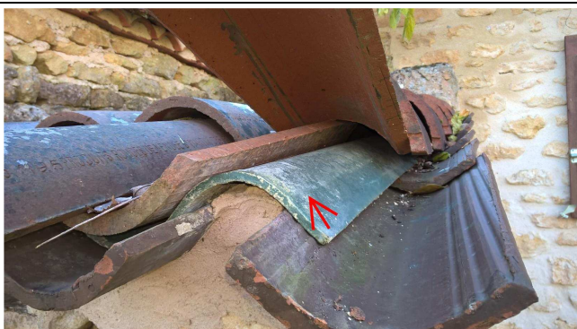
001 : Plaques ondulées fibres ciment Dégagement 2 PRE:001