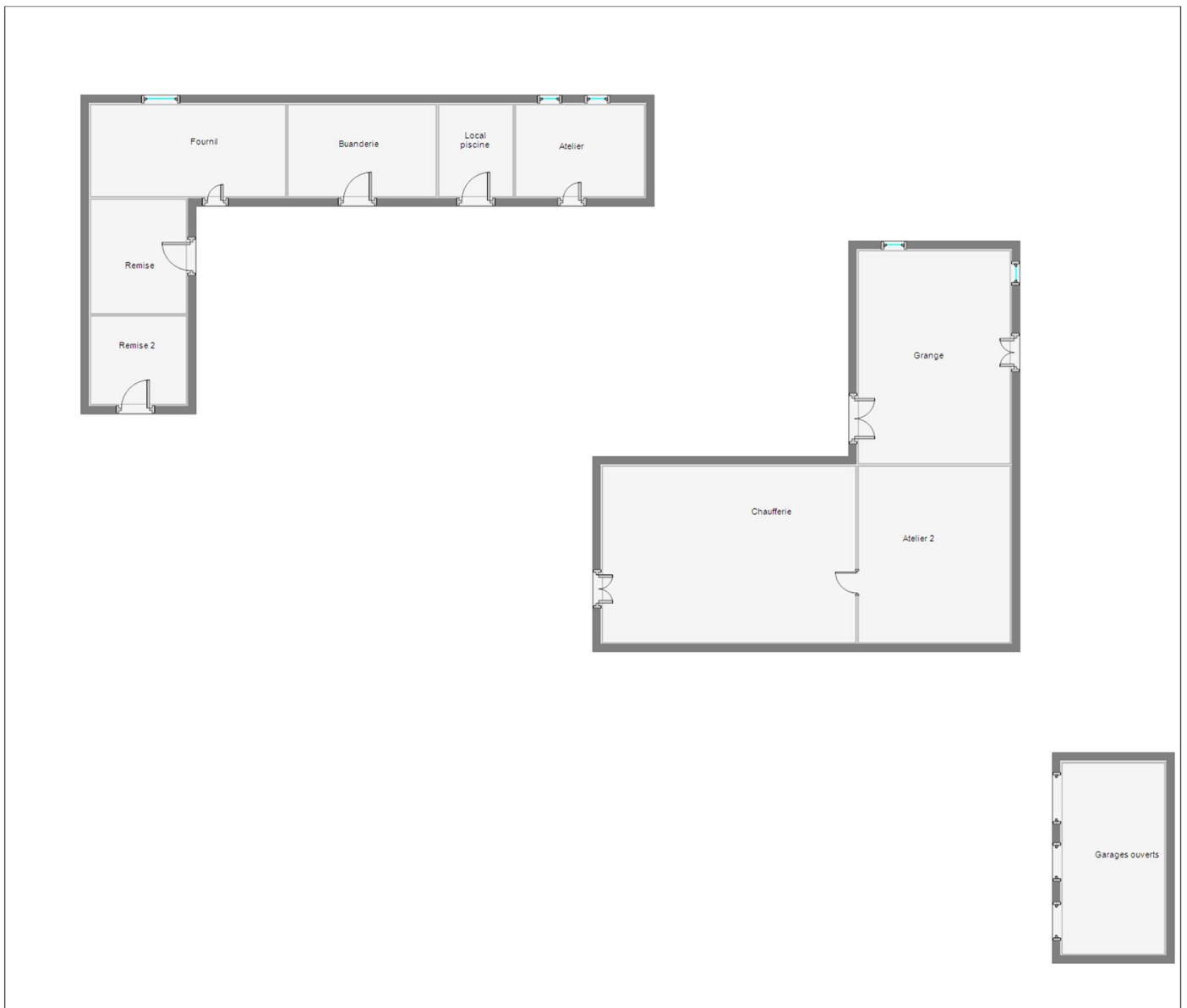
M. RUSSELL Maison - Entamnies 24620 TURSAC Niveau 0 - Dépendance