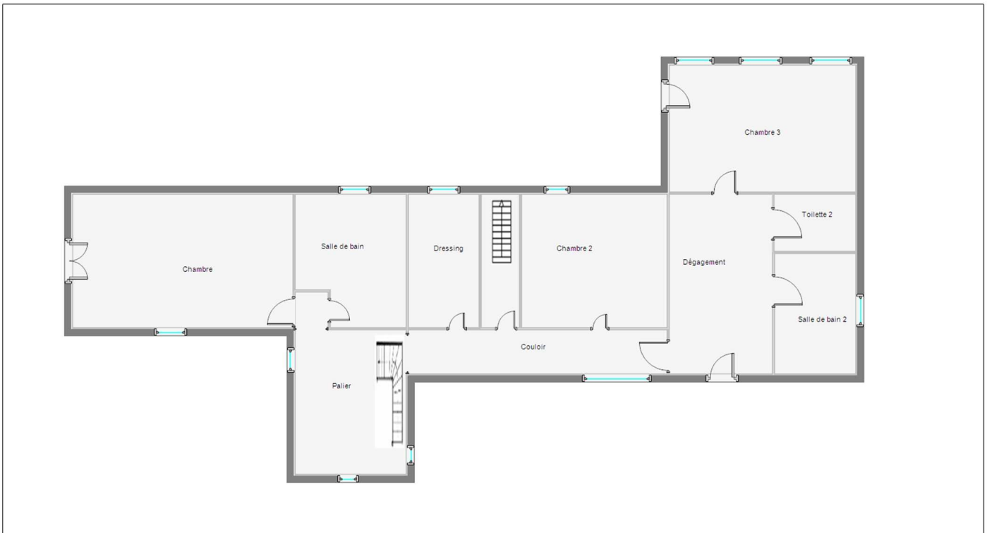
M. RUSSELL Maison - Entamnies 24620 TURSAC Niveau 1