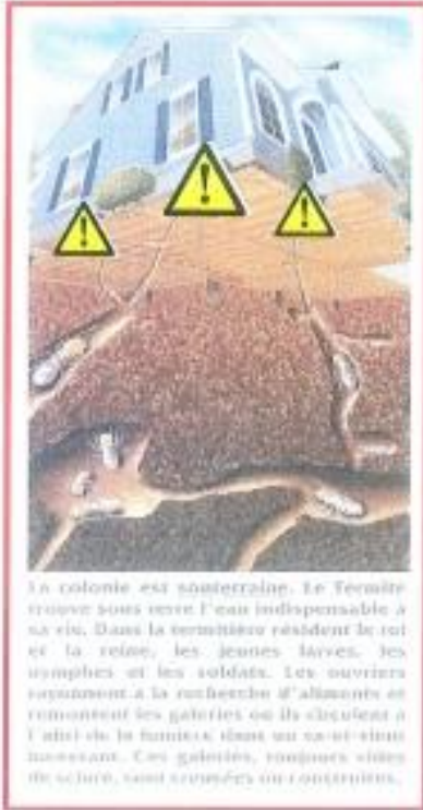
La colonie est souterraine. Le termitier trouve sous terre l'eau indispensable à sa vie. Dans la termitière résident le roi et la reine, les jeunes larves, les nymphes et les soldats. Les ouvriers travaillent à la recherche d'aliments et remontent les galeries où ils circulent à l'aide de la fumée dans un mouvement incessant. Ces galeries, toujours vides de sucre, sont remplis de nourriture.